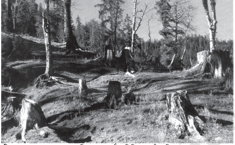
चित्र 9.3 वन-कटाव द्वारा भूमि अपक्षय, जैव विविधता की क्षति तथा वायु प्रदूषण

माँग-पूर्ति संबंध पूरी तरह से उलट गये हैं—अब हमारे सामने पर्यावरण संसाधनों और सेवाओं की माँग अधिक है, लेकिन उनकी पूर्ति सीमित है। जिसके कारण अधिक उपयोग और दुरुपयोग हैं। इसीलिए, अवशिष्ट सृजन और प्रदूषण के पर्यावरण मुद्दे आजकल बहुत गंभीर हो गये हैं।