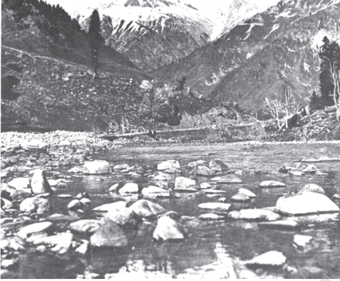
चित्र 9.1 ताजा पानी के कुछ स्रोत जो प्रदूषण रहित हैं

ऐसा नहीं होता, तो पर्यावरण जीवन पोषण का अपना तीसरा और महत्वपूर्ण कार्य करने में असफल हो जाता है और इससे पर्यावरण संकट पैदा होता है। पूरे विश्व में आज यही स्थिति है। विकासशील देशों की तेजी से बढ़ती जनसंख्या और विकसित देशों के समृद्ध उपभोग तथा उत्पादन मानकों ने पर्यावरण के पहले दो कार्यों पर भारी दबाव डाल डाला है। अनेक संसाधन विलुप्त हो गये हैं और सृजित अवशेष पर्यावरण के अवशोषी क्षमता के बाहर हैं।