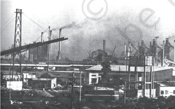
चित्र 9.2 दमोदर घाटी भारत के सर्वाधिक औद्योगिक क्षेत्रों में एक है। भारी उद्योगों से प्रदूषणकारी तत्व दामोदर नदी के किनारे जमा होकर पर्यावरण-संकट उत्पन्न कर रहे हैं

और सेवाएँ उनकी पूर्ति से बहुत कम थी। इसका अर्थ हुआ कि प्रदूषण, पर्यावरण की अवशोषी क्षमता के भीतर था और संसाधन निष्कर्षण की दर इन संसाधनों के पुनः सर्जन की दर से कम थी। इसलिए, पर्यावरण समस्याएँ उत्पन्न नहीं हुई थी। लेकिन, जनसंख्या विस्फोट और जनसंख्या की बढ़ती हुई आवश्यकताओं की पूर्ति के लिए औद्योगिक क्रांति के आगमन से स्थिति बदल गई। परिणामस्वरूप उत्पादन और उपभोग के लिए संसाधनों की माँग संसाधनों की पुनः सर्जन की दर से बहुत अधिक हो गई; पर्यावरण की अवशोषी क्षमता पर दबाव बुरी तरह से बढ़ गया। यह प्रवृत्ति आज भी जारी है। इस तरह से, पर्यावरण की गुणवत्ता के मामले में