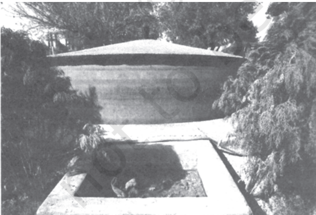
चित्र 9.4 गोबर गैस संयंत्र में ईंधन उत्पादन के लिए गोबर का प्रयोग

ऊर्जा के गैर पारंपरिक स्रोतों का उपयोग : जैसा कि आप जानते हैं कि भारत अपनी विद्युत आवश्यकताओं के लिए थर्मल और हाइड्रो पॉवर संयंत्रों पर बहुत अधिक निर्भर है। इन दोनों का पर्यावरण पर प्रतिकूल प्रभाव पड़ता है। थर्मल पॉवर संयंत्र बड़ी मात्रा में कार्बन-डाइऑक्साइड का उत्सर्जन करते हैं, जो एक ग्रीन हाउस गैस है। थर्मल पॉवर प्लांटों से बड़ी मात्रा में धुएँ के रूप में राख भी निकलती है, जिसका उचित उपयोग न हो तो जल, भूमि और पर्यावरण के अन्य संघटकों के प्रदूषण का कारण हो सकता है। जल-विद्युत परियोजनाओं से वन जलमग्न हो जाते हैं और नदी प्रवाह क्षेत्रों तथा नदी की घाटियों के प्राकृतिक प्रवाह में हस्तक्षेप करते हैं। वायु शक्ति और सौर किरणें पारंपरिक ऊर्जा के अच्छे उदाहरण हैं। हाल के वर्षों में, इन ऊर्जा संसाधनों का लाभ उठाने के लिए कुछ प्रयास किए जा रहे हैं। अपने क्षेत्र में स्थापित किसी भी इकाई का विवरण एकत्र करें (यदि कोई हो) और कक्षा में चर्चा करें।