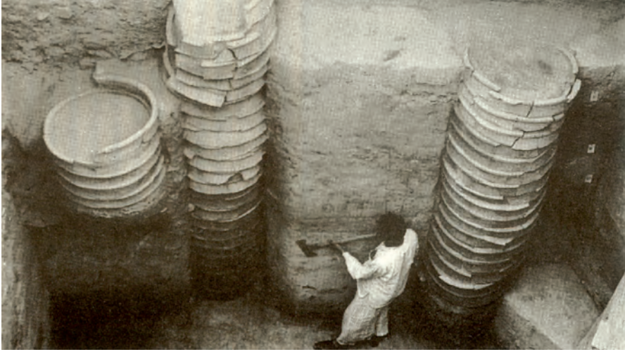
दिल्ली में मिला वलयकूप।

हड़प्पा की जल निकास व्यवस्था से यह कैसे भिन्न है?