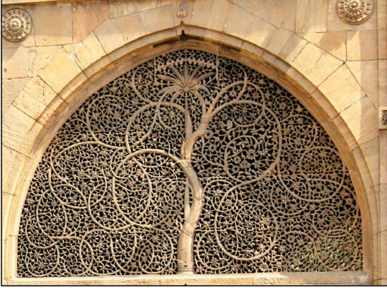
સીદી સૈયદની જાળી

અમદાવાદનાં વિશિષ્ટ સ્થાપત્યોમાં સીદી સૈયદની જાળી વિશ્વવિખ્યાત