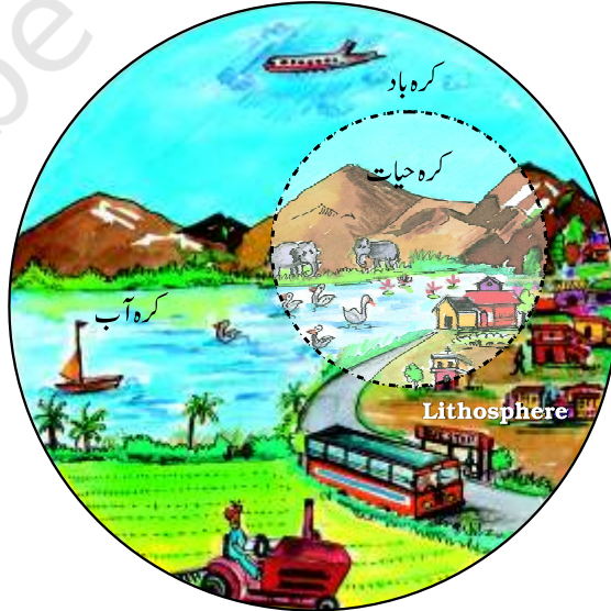
شکل 1.2: ماحول کی اقلیمیں

آپ کے گھر اور اسکول میں پانی کہاں سے آتا ہے؟ ایک فہرست تیار کیجیے کہ ہم اپنی روزمرہ کی زندگی میں پانی کن مختلف کاموں میں لاتے ہیں۔ آپ نے کسی کو پانی ضائع کرتے دیکھا ہے؟ کیسے؟