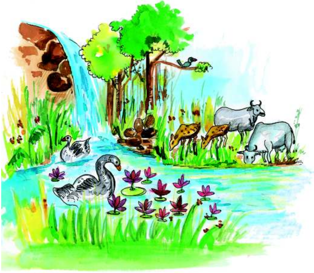
شکل 1.3 ایک تالاب ماحولیاتی نظام

رشتہ ہوتا ہے، حیاتیاتی اجزا کا آپس میں اور اپنے ماحول کے ساتھ باہمی تفاعل یا تعلقات کو ہی ماحولیاتی نظام (ECO SYSTEM) کہتے ہیں۔ بڑے بارانی جنگلات، گھاس کے میدان، ریگستان، پہاڑ، جھیل، دریا، سمندر یہاں تک کہ ایک چھوٹے سے تالاب کا بھی ماحولیاتی نظام ہوتا ہے۔