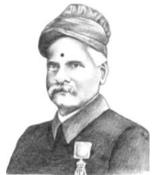
ৰাজা ৰবি ভাৰ্মা

ঔপনিৱেশিক সংস্কৃতিৰ লগত প্ৰত্যক্ষ মুখামুখিৰ ফলত আমাৰ দেশৰ সাংস্কৃতিক জগতলৈ কেনেদৰে পৰিৱৰ্তন আহিছিল সেই বিষয়ে তোমালোকে ভিন ভিন পৰ্যায়ত দেখিবলৈ পাইছা। সমসাময়িক পৰিস্থিতিত সঘনে দেখিবলৈ পোৱা প্ৰজন্মবোৰৰ মাজৰ সংঘাতবোৰো ক'বলৈ গ'লে সাংস্কৃতিক সংঘাত যিবোৰ পশ্চিমীয়া-কৰণৰে পৰিণতি। তলৰ সীমাৰেখাৰ ভিতৰত বৰ্ণনা কৰা পিচৰ কথাখিনিয়ে দুটা প্ৰজন্মৰ