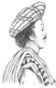
ৰাজা ৰামমোহন ৰয়

আমাৰ জীৱনত ঔপনিৱেশিকতাবাদৰ সূদূৰ প্ৰসাৰী প্ৰভাৱৰ বিষয়ে তোমালোকে বুজিব পাৰিলা। ঔপনিৱেশিক শাসন কালত থকা ভাৰতীয় সমাজব্যৱস্থাই যিবোৰ প্ৰত্যাৱানৰ সন্মুখীন হৈছিল তাৰেই ফলশ্ৰুতিত উনৈশ শতিকাত এক সামাজিক সংস্কাৰ আন্দোলন গঢ় লৈ উঠিছিল। সেই সময়ত ভাৰতৰ সমাজ-