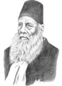
ছাৰ চৈয়দ আহমেদ খান

ব্যৱস্থাত প্ৰচলিত কিছুমান সামাজিক অন্ধবিশ্বাস, কু-সংস্কাৰৰ বিষয়ে সম্ভৱতঃ তোমালোকে জানা। সেইবোৰৰ ভিতৰত সতীদাহ প্ৰথা, বাল্যবিবাহ, বিধৱা বিবাহ আৰু জাতি-বৈষম্যই আছিল অন্যতম। অৱশ্যে প্ৰাক্ ঔপনিৱেশিক কালত এনে সামাজিক বৈষম্যবোৰ প্ৰতিহত কৰিবলৈ প্ৰচেষ্টা যে কৰা নাছিল এনে নহয়। সেই সময়ত বৌদ্ধধৰ্মৰ আদৰ্শই এইবোৰৰ বিৰুদ্ধে মাত-মাতি আহিছিল। তাৰোপৰি ভক্তি আন্দোলন আৰু ছুফি আন্দোলনেও এইবোৰৰ প্ৰতিবাদ জনাই আহিছিল। ১৯ শতিকাত গা কৰি উঠা সামাজিক সংস্কাৰ আন্দোলনত আধুনিকতাৰ লগতে বিভিন্ন ভাৱাদৰ্শৰ সংমিশ্ৰণ ঘটিছিল। প্ৰকৃতাৰ্থত ক'বলৈ গ'লে ই আছিল পশ্চিমীয়া মুক্ত ভাৱাদৰ্শ আৰু পৰম্পৰাগত সাহিত্যৰাজিৰ ওপৰত নৱ দৃষ্টিৰ এক সৃষ্টিশীল সংমিশ্ৰণ।