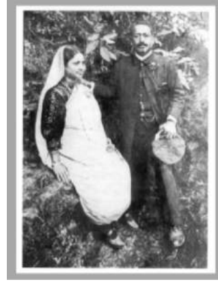
পৰম্পৰা আৰু আধুনিক সাজ - পোছাকৰ সংমিশ্ৰণ

Source: A.K. Ramanujan in Marriot ed. 1990: 42