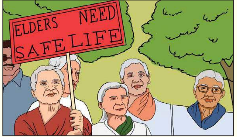
21.5 વૃદ્ધોને રક્ષણ સલામતી

ઓક્ટોબરના દિવસને ‘વિશ્વ વૃદ્ધ દિન’ તરીકે આંતરરાષ્ટ્રીય સ્તરે ઉજવવામાં આવે છે.