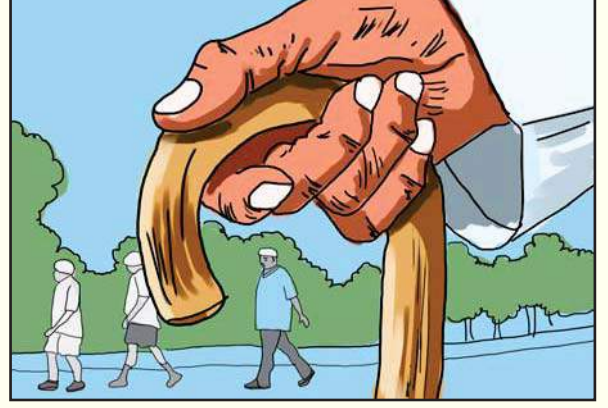
21.4 વૃદ્ધોને સહાય

પશ્ચિમી સંસ્કૃતિ, વિભક્ત કુટુંબમાં રહેવાની ઘેલછાએ સંતાનો આ વૃદ્ધ માતા-પિતા તરફની નૈતિક ફરજો, મૂલ્યો અને સંસ્કૃતિ ભુલાવ્યાં છે. વૃદ્ધ માતાપિતાને આર્થિક મદદ સંવેદના કે લાગણીશૂન્ય વર્તન વ્યવહારથી મજબૂર બનીને ‘ઘરડા ઘરો’ (વૃદ્ધાશ્રમો)માં રહેવાની ફરજ પડે છે. વૃદ્ધોની સમસ્યાઓ પ્રત્યે લોકોનું ધ્યાન ખેંચવા માટે સંયુક્ત રાષ્ટ્રોએ (UN) સન 1999ના વર્ષને ‘આંતરરાષ્ટ્રીય વૃદ્ધ વર્ષ’ તરીકે ઘોષિત કર્યું હતું. તેમજ પ્રત્યેક વર્ષે તા. 1 લી (પહેલી)